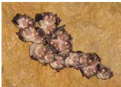
CR Colonie de 16 rhinolophes euryales

** Déclassement de 2 catégories selon les critères UICN (UICN, 2003)