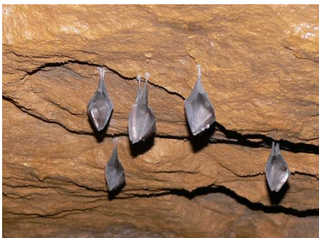
Figure 3 : Petits Rhinolophes

Trois espèces de Rhinolophe sont présentes en Franche-Comté : le Petit rhinolophe, le Grand rhinolophe et le Rhinolophe euryale. C'est la présence du Petit et du Grand rhinolophe qui a conduit à la création du « Réseau de cavités à Rhinolophe de la région de Vesoul ». Ces deux espèces utilisent principalement les cavités pendant les périodes d'hibernation et de transit. Elles peuvent aussi s'y installer en période estivale, mais ont une affinité plus prononcée avec le milieu bâti. Le « Réseau de cavités à Rhinolophe de la région de Vesoul » comprend quatre cavités qui servent de gîtes hivernaux et de transit au Grand et Petit rhinolophe.