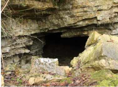
Figure 1 : Entrée de la Grotte de Gravelle

des acteurs locaux pour l'intégration des enjeux de biodiversité aux pratiques humaines. Il se concrétise notamment par la signature de contrats, par lesquels le co-contractant s'engage au respect de bonnes pratiques ou à la réalisation de travaux en contrepartie du soutien financier de l'Europe et la Région bourgogne-Franche-Comté. Afin de mener à bien cette mission, un animateur est désigné pour chaque site Natura 2000.