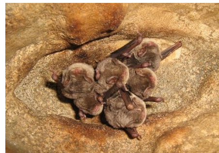
Figure 2 : Minioptère de Schreibers

Le Minioptère de Schreibers est une espèce à fort enjeu en Franche Comté. Les populations sont actuellement en nette régression sans que l'on arrive à définir les causes exactes de cet effondrement [1]. Cette espèce est quasi-exclusivement cavernicole sur l'ensemble de son cycle biologique [2]. D'où l'importance majeure de la mise en protection du réseau de cavités qui l'hébergent et notamment le site Natura 2000 du « Réseau de cavités à Minioptère de Schreibers en Franche-Comté ». Il se compose de six cavités qui abritent cette espèce lors des différentes étapes de son cycle de vie, mais aussi 14 autres espèces de chauves-souris.